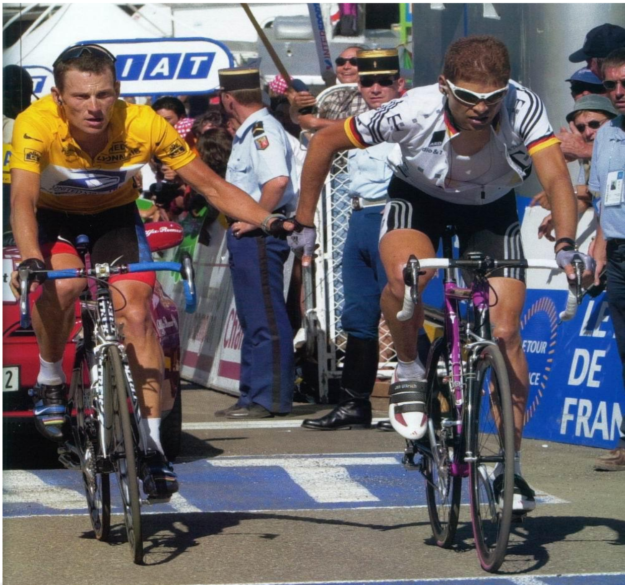
Лэнс Армстронг и Ян Ульрих