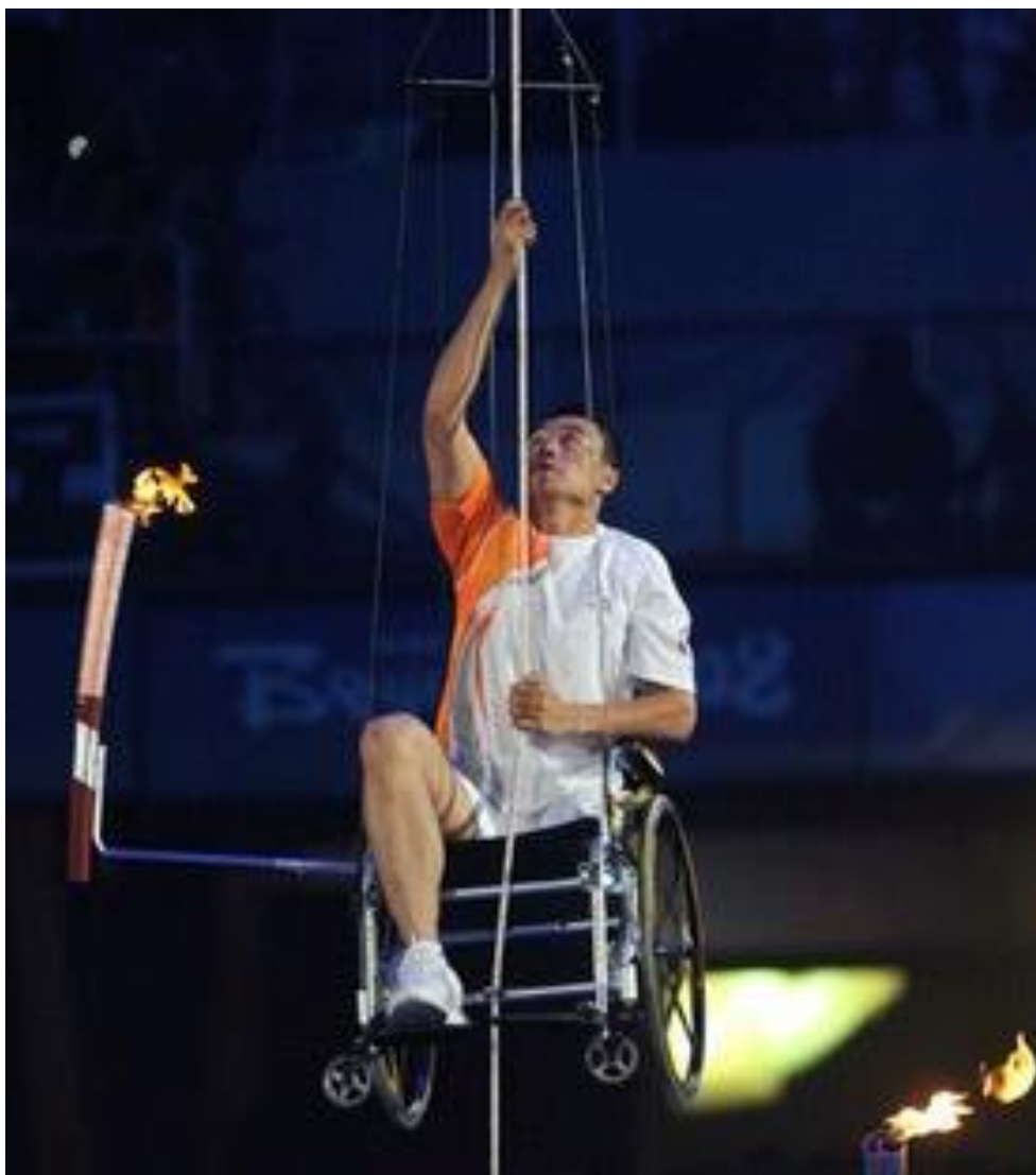
Церемония открытия Паралимпийских игр в Пекине